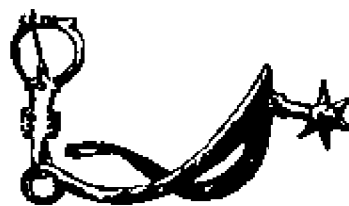
Рис. 53. Ранний тип шпоры с колесиком, около 1300 года