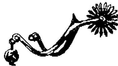
Рис. 54. Шпора с большим колесиком; 1330—1360 годы

Когда люди видят такие длинные шпоры и острые шипы на колесиках, то многие